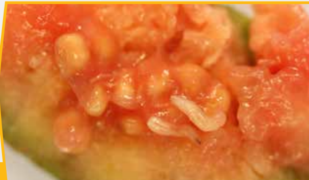
Fruit fly larvae on guava.

Ko te au kai 'ua rakau e te au vetitepara tei kore e arapaki'ia e teia turanga kino, teia te reira: te apuka, te kuru, te au anani, te au anani mandarin , e tetai au kai ua rakau akaou mai turanga citrus , te papaya , te passionfruit , te tuava, te vi, e te au tomati.